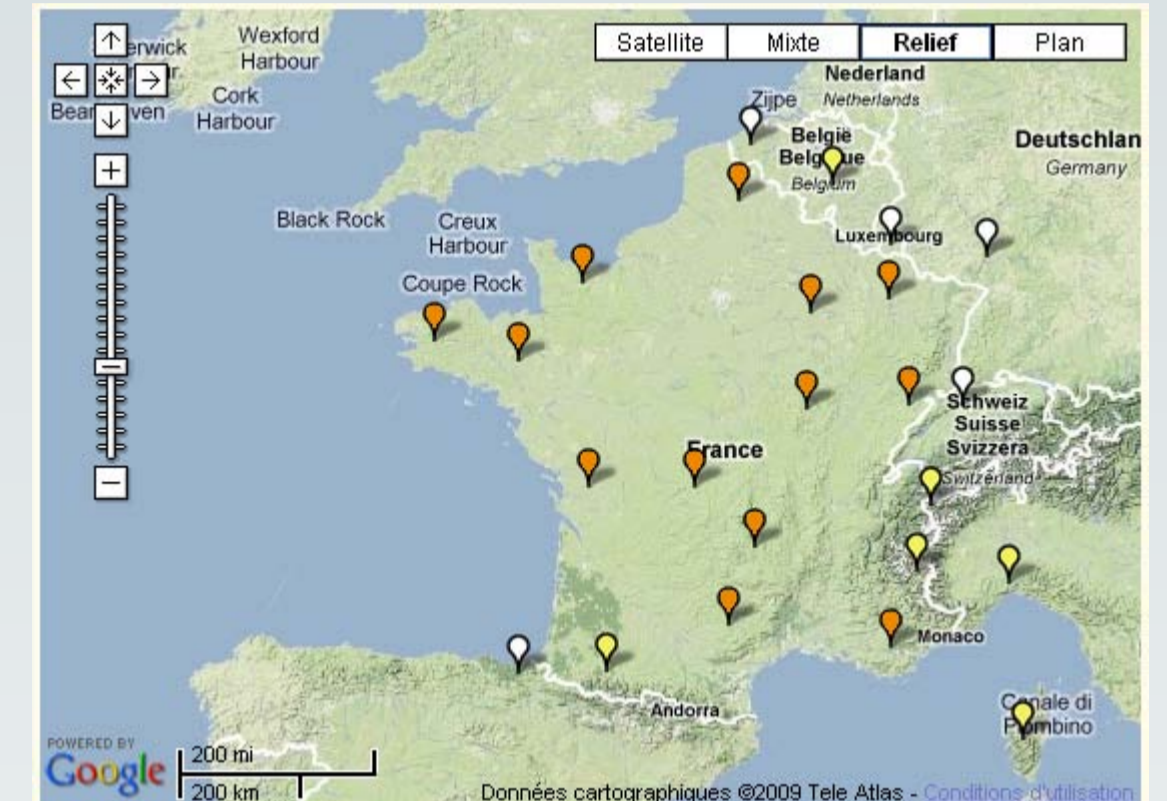
Langues en danger en France selon l'Atlas UNESCO

En France, ces langues subissent un déclin du nombre de leurs locuteurs et elles sont considérées comme des langues en danger (LED). Le francoprovençal peut apparaître comme plus menacé car il ne dispose pas d'une reconnaissance officielle et n'est pratiquement pas enseigné. Le terme francoprovençal est le plus souvent ignoré de ses locuteurs eux-mêmes et les associations de promotion de la langue, si elles sont de plus en plus nombreuses, peinent à se fédérer. La situation de l'occitan peut a priori paraître plus favorable, mais en Rhône-Alpes l'usage de l'occitan diminue et son enseignement reste fragile.