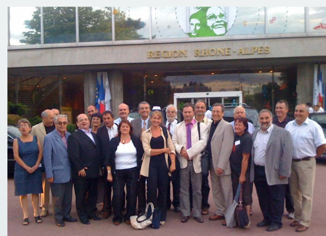
Devant l'hôtel de Région, à l'issue du vote

Ce texte voté en juillet 2008 à la suite de la remise de l'étude FORA, prévoit en particulier d'accorder une place aux langues régionales dans les dispositifs régionaux, d'agir en faveur de la reconnaissance et de l'enseignement de ces langues, ainsi que le lancement de projets transversaux en coordination avec les associations et les centres de recherche.